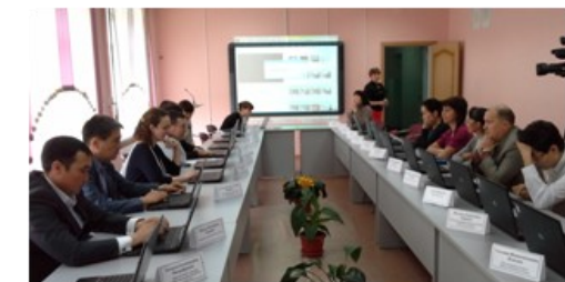
Защита родителями проекта по гос.-общ. управлению