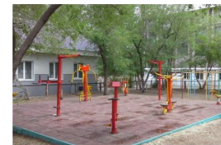
Новая спортивная площадка школы

По результатам анкетирования жителей микрорайона волнуют такие проблемы: благоустройство и озеленение дворов, отсутствие детских и спортивных площадок, освещение улиц, бездомные собаки. Не развивается парк «Юбилейный», игровые и пивные заведения находятся недалеко от школы и другие. Бюджет, в том числе и муниципальный, расходуется по программно-целевому методу. Многие проблемы, поставленные жителями микрорайона, могут войти в программы, которые есть в муниципалитете: «Зеленый город», «Город детства», ремонт дорог. Какие - то программы нужно инициировать!